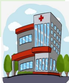
รพ.ปลายทาง

3. โรคมะเร็งไปรับบริการที่ไหนก็ได้ที่พร้อม : แพทย์ผู้รักษาให้ข้อมูลโรงพยาบาลที่พร้อมให้บริการแก่ผู้ป่วยที่ได้รับการวินิจฉัยมะเร็ง เพื่อตัดสินใจร่วมกัน