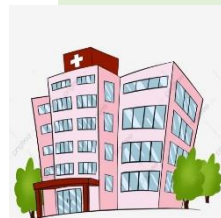
รพ.ตามสิทธิ

2. บริการ “ดูแลผู้ป่วยไม่จำเป็นต้องกลับไปขอรับใบส่งตัว” : กรณีมาเอง 1. จุกเฉิน (เข้ารับจุกเฉิน) 2. ท้าวไป (จ่ายเอง)